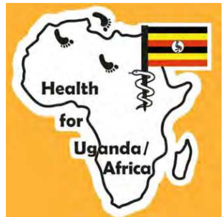
Vertreter der Health for Uganda Africa e.V. am 17. Mai 2019 auf unserem Stand