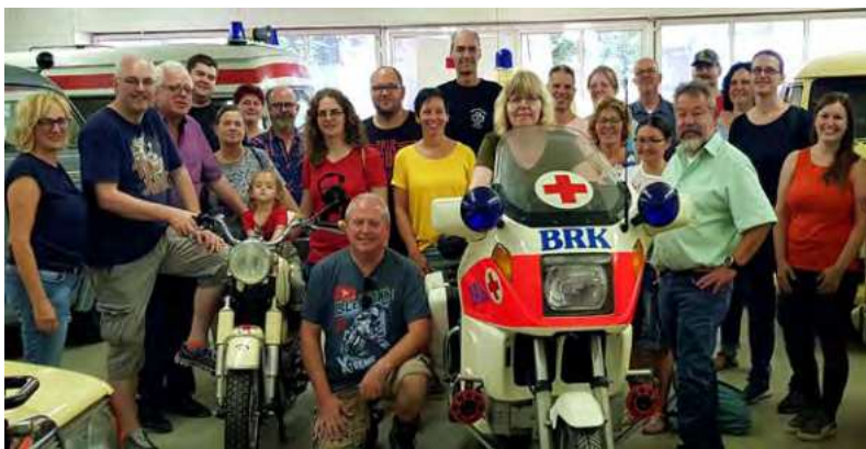
Besuchergroupe vom DRK Ortsverein Gundelsheim