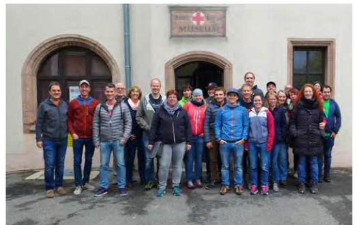
BRK-Bereitschaft Obersdorf am 05.10.2019

Die „Jagd auf Mister X“ fand auch 2019 wieder statt. Über 100 Teilnehmer aus dem JRK und der Bereitschaftsjugend waren wieder nach Nürnberg gekommen, um bei bestem Wetter, das von der Bezirksleitung des JRK Ober-/Mittelfranken organisierte Spiel mitzumachen. Parallel dazu konnte auch das Rotkreuz-Museum besucht werden!