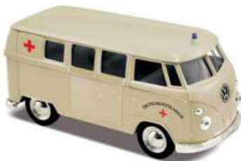
VW T1 Krankenwagen mit DRK-Logo