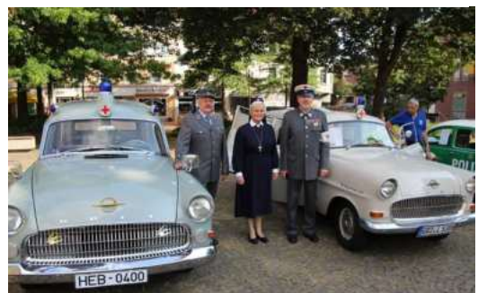
Links Opel Kapitän Baujahr 1956( Hersbruck) und Opel Olympia Baujahr 1958 v. DRK Greiz