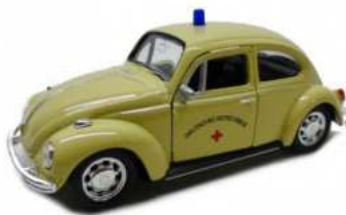
Modellfahrzeug VW Käfer mit DRK-Logo