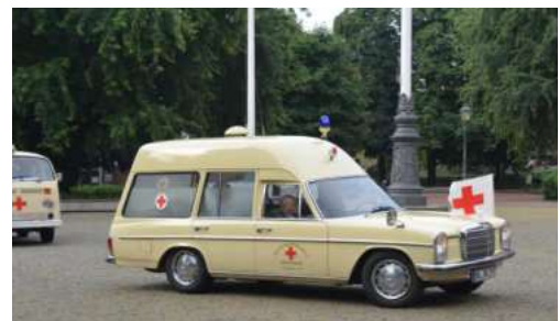
Daimler Benz 230/8 Baujahr 1970