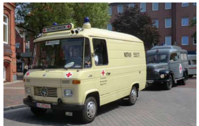
Rettungswagen MB L 408 Binz Baujahr 1972