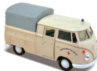
VW T1 Doppelkabine mit DRK-Logo