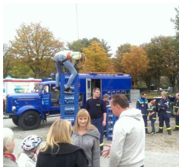
Hilfsorganisationen THW mit Ausstellung und Kinderbetreuung