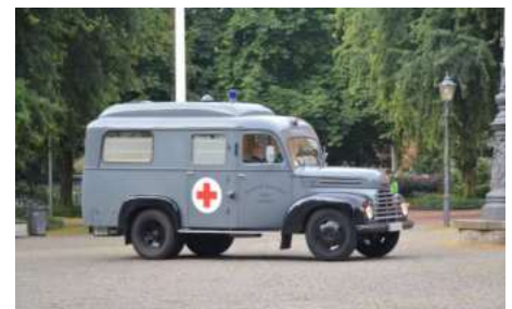
Ford G3 Baujahr 1955