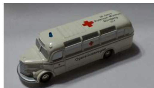
Schuco Piccolo Modell MB O3500 Mit Beschriftung 30 Jahre Rotkreuz-Museum