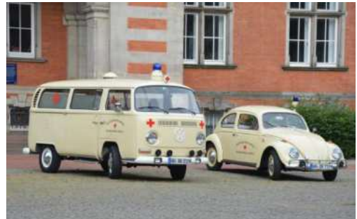
VW T2 "Bulli" Baujahr 1968 und VW 1600 "Käfer" Baujahr: 1967