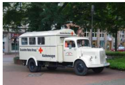
Küchenwagen MB L 312 Baujahr 1958