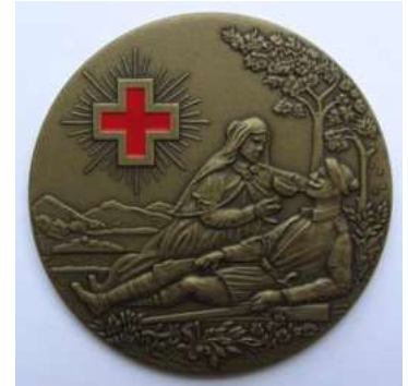
Medaille „Helfende Hände“