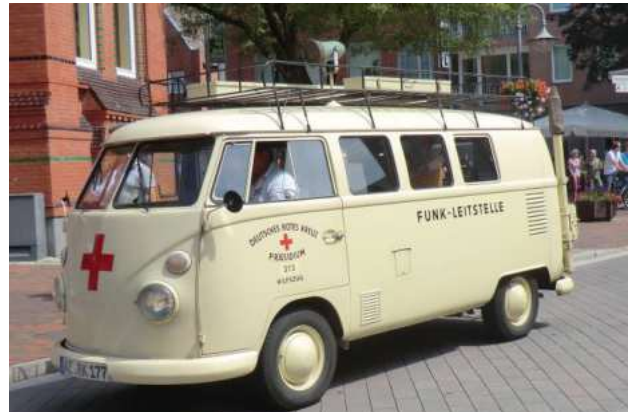
Fernmeldekraftwagen Baujahr 1964