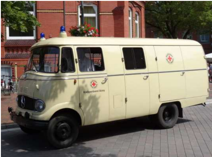
Mercedes-Benz L 319 Baujahr 1963