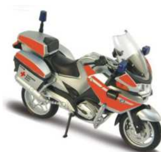
BMW R 1200 RT DRK Welly Motorrad Modell 1:18

Bestellung: www.rotkreuz-museum-nuernberg.de