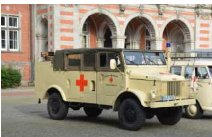
Borgward Baujahr 1957