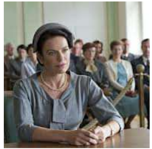
Drehort: Universität Tübingen mit Christine Neubauer in der Hauptrolle