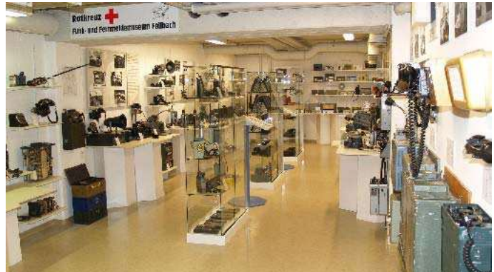
Rotkreuz Funk- und Fernmeldemuseum Fellbach