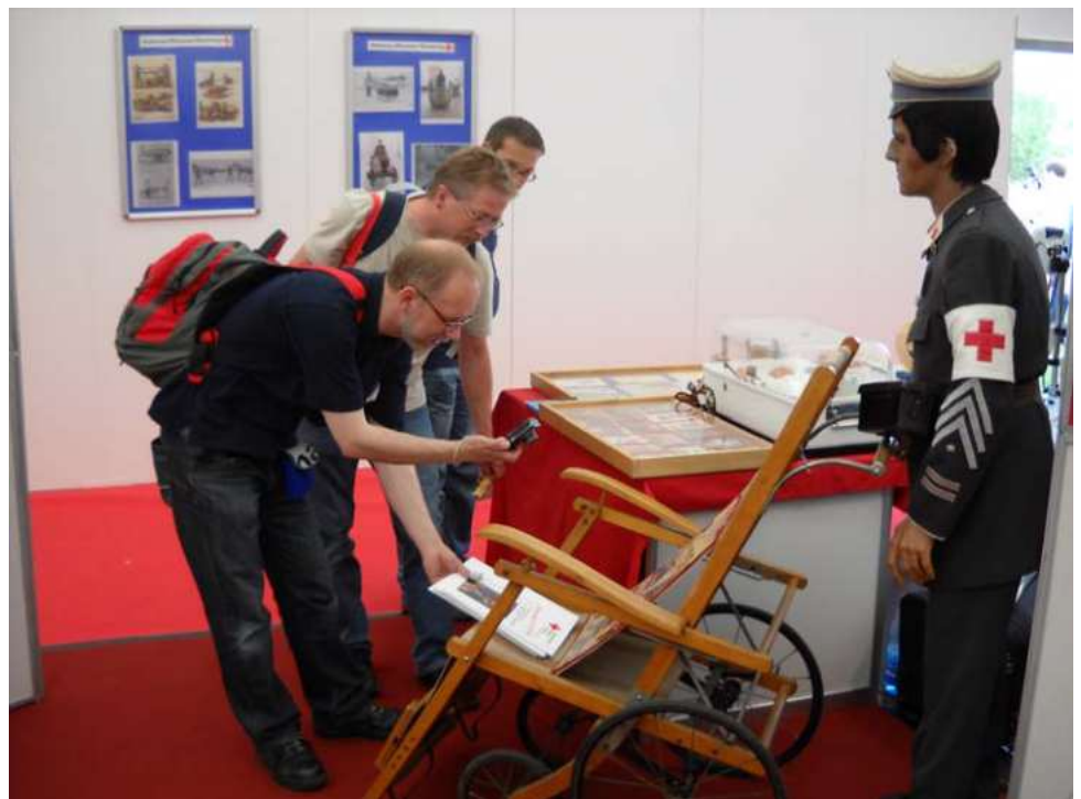
Bild rechts: Hier findet eine alte ERSTE-Hilfe-Anleitung Begeisterung beim Fachpublikum. Neben den alten Exponaten sind unsere Modellautos aus dem Rettungswesen immer sehr gefragt.

Ein Highlight unserer Museums-Aktivitäten in 2011 war wie jedes Jahr die Ausstellung auf der RETTmobil, eine europäische Leitmesse für Rettung und Mobilität.