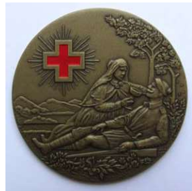
Medaille „Helfende Hände“