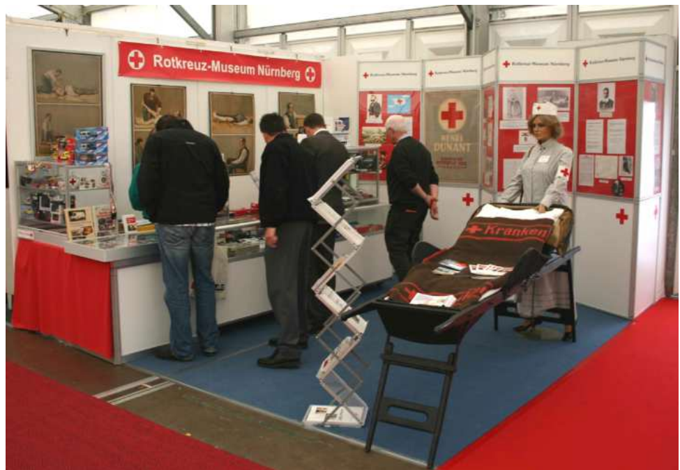
Stand des Rotkreuz-Museums Nürnberg auf der RETTmobil in Fulda