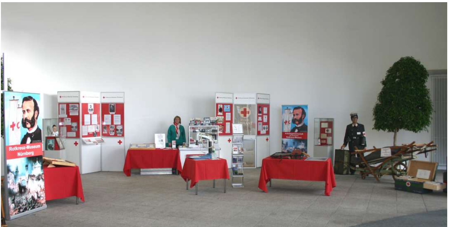
Ausstellung Foyer Hannover-Messe