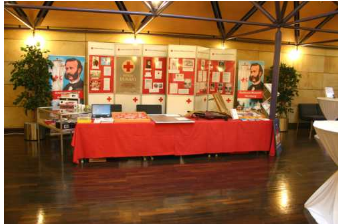
Infostand Museum Landesversammlung in Fürth