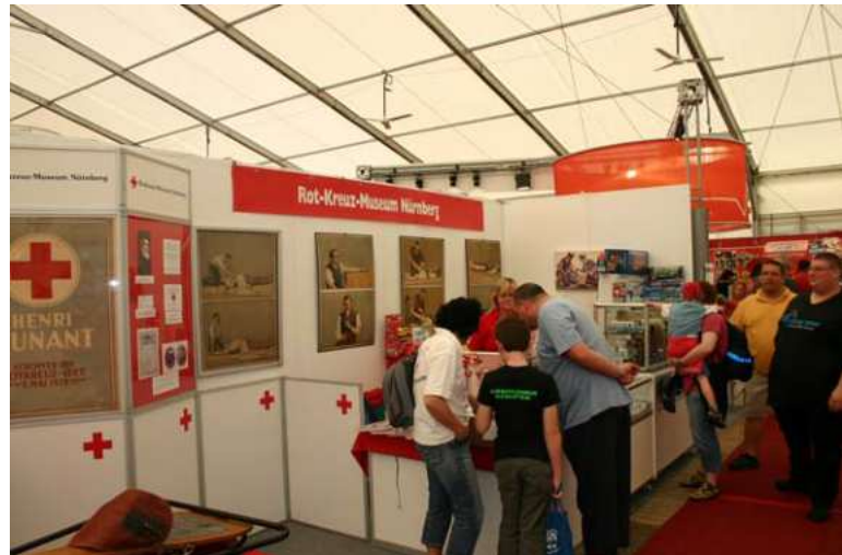
Stand des Rotkreuz-Museums Nürnberg auf der RETTmobil in Fulda